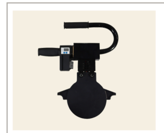
แผ่นให้ความร้อน