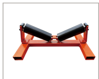
ลูกกลิ้งสำหรับท่อ