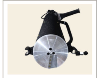
เครื่องปาดท่อ