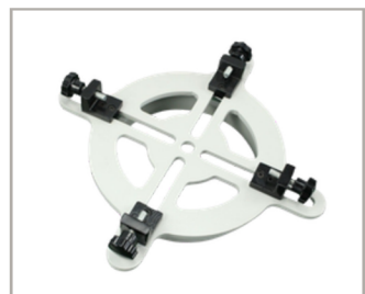
ตัวจับแปลงหน้าจาน