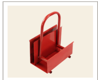
อุปกรณ์รองรับ