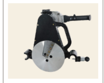
เครื่องปาดท่อ