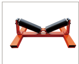
ลูกกลิ้งสำหรับท่อ