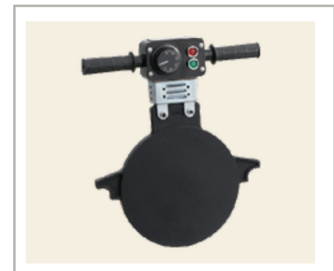
แผ่นให้ความร้อน