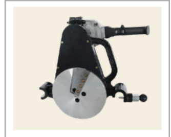
เครื่องปาดท่อ