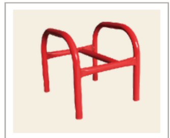
อุปกรณ์รองรับ