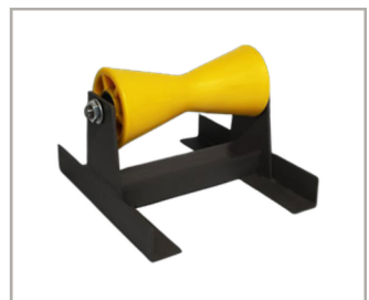
ลูกกลิ้งสำหรับท่อ