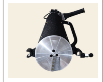
เครื่องปาดท่อ