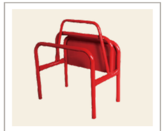
อุปกรณ์รองรับ