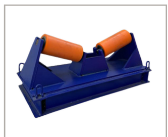
ลูกกลิ้งสำหรับท่อ