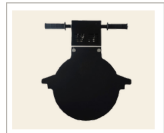
แผ่นให้ความร้อน