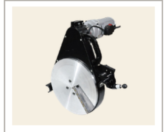
เครื่องปาดท่อ