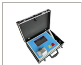
เครื่องบันทึกข้อมูล เก็บข้อมูลการเชื่อม