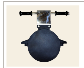
แผ่นให้ความร้อน