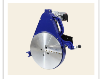
เครื่องปาดท่อ