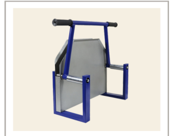
อุปกรณ์รองรับ