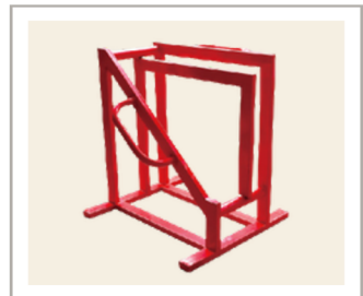
อุปกรณ์รองรับ