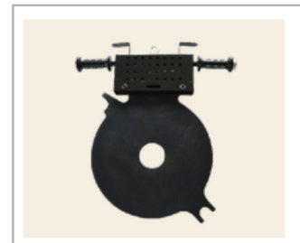
แผ่นให้ความร้อน