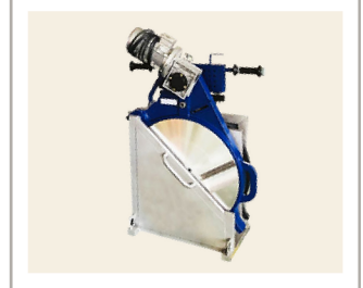
เครื่องปาดท่อ