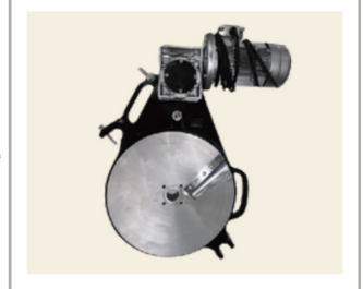
เครื่องปาดท่อ