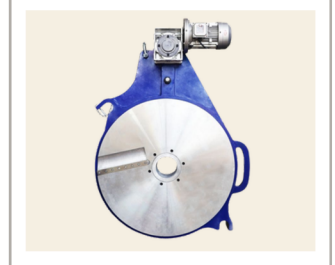
เครื่องปาดท่อ