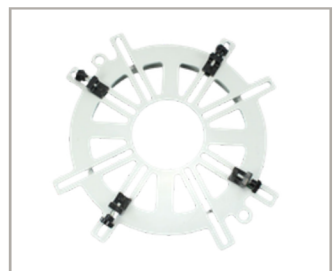
ตัวจับแปลงหน้าจอน