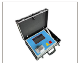
เครื่องบันทึกข้อมูล เก็บข้อมูลการเชื่อม