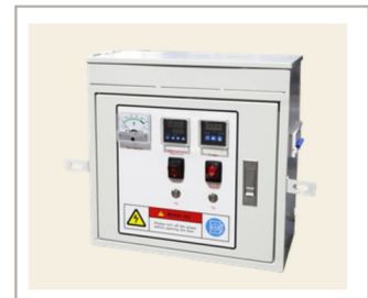
กล่องเชื่อมต่อไฟฟ้า