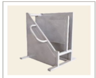
อุปกรณ์รองรับ