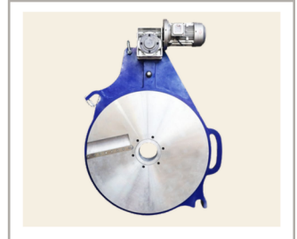
เครื่องปาดท่อ